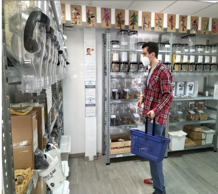
Extension du rayon Vrac