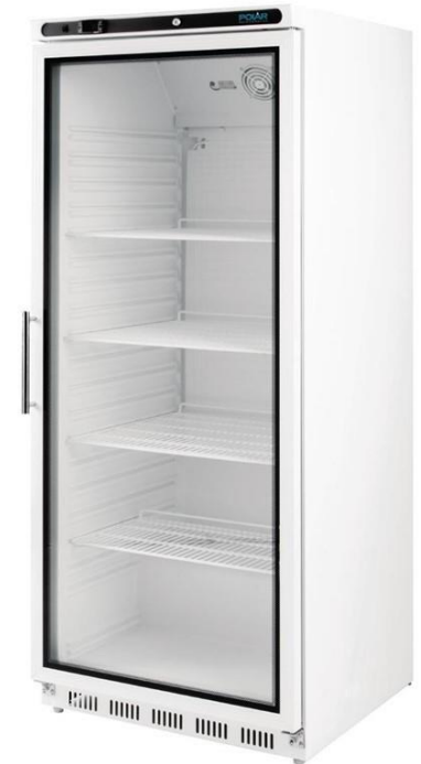
Ajout d'une vitrine réfrigérée