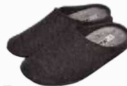
↗ BV035N.(+ pointure) Chausson feutre noir chiné