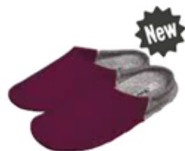
↗ BV035RB.(+ pointure) Chausson en feutre bordeaux / gris chiné

Pour des pieds au chaud et respirants : une petite fabrique italienne confectionne ces chaussons en feutre 100 % laine.