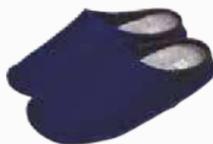
↗ BV035B.(+ pointure) Chausson feutre bleu chiné