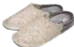
↗ BV035C.(+ pointure) Chausson feutre crème / gris chiné