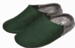
↗ BV035V.(+ pointure) Chausson feutre vert / gris chiné