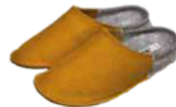
↗ BV035J.(+ pointure) Chausson feutre ocre / gris chiné